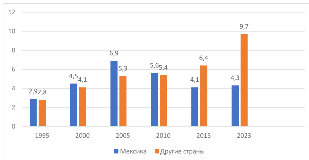
Рис.2. Динамика количества нелегальных мигрантов в США в 1995-2023 гг., млн чел.